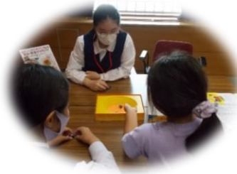
図書館でボードゲームを遊ぶ会