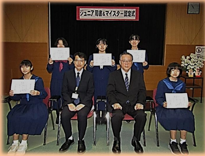
【ジュニア司書10期生代表挨拶】

新型コロナウイルスで活動が制限されている中、図書館に貼られていたジュニア司書養成講座のポスターを見たとき待ち望んでいたもので、とても嬉しい気持ちでいっぱいでした。開講していただき、本当にありがとうございました。